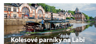
Kolesové parníky na Labi

Město zdobí četné sady a parky, je obklopeno rozsáhlými lesy a mnoha rybníky. Na své si přijdou milovníci cykloturistiky, hipoturistiky, ale i ti, kteří propadli modernímu trendu in-line bruslení. Řeky Labe a Orlice lemují romantické pěšinky lákající k romantickým procházkám.